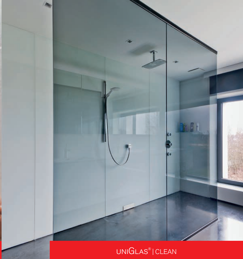
UNI GLAS ® | CLEAN

Trotz regelmäßiger Reinigung verliert das Glas von Ganzglasduschen, Duschwänden und Duschkabinen mit der Zeit seine Brillanz. Kleine milchige, raue Stellen entstehen auf der Glasoberfläche, wo sich bevorzugt Kalk, Schmutz und gesundheitsgefährdender Schimmel anlagert.